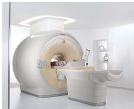
Achieva 1.5T （2011年8月頃稼動） 特徴：撮像の高速化