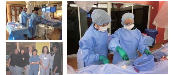
実習風景(左上、右)、AHHスタッフと共に(左下)