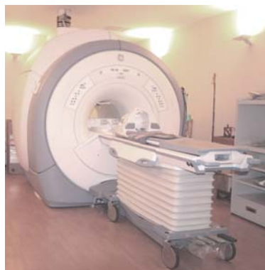
Signa HDxt 1.5T 特徴：高分解能撮像