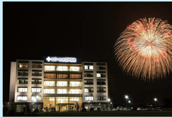
『小江戸の花火』三愛フォトクラブ 小林久雄