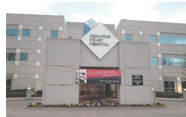
アーカンソーハートホスピタル正面入口