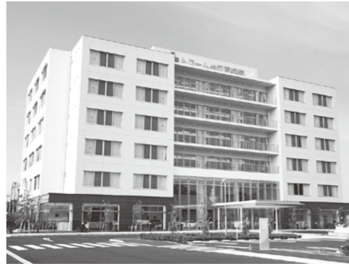
患者の尊厳を重視し、愛情込めた医療の提供を目指す「トワーム小江戸病院」

小江戸病院でGE社製の最新型MRI3・0テスラを導入。さらに、一・一年春には三愛病院で同じMRI3・0テスラの追加導入も契約済みだ。 両病院に導入されるMRI3・0テスラはMRI1・5テスラに比べて二倍の磁場強度を持つっており、従来のものと比較しても超高速撮影に優れ、高速かつ高画質な検査が可能になる。しかも、鮮明な画像診断が得られるだけでなく、より小さな病変を早期に見ることができる。 特に頭部検査にその威力を発揮すると言われており、「一ミリの程度の微小出血や脳脊髄液の流れをリアルタイムに描出でき、認知症の診断に大い