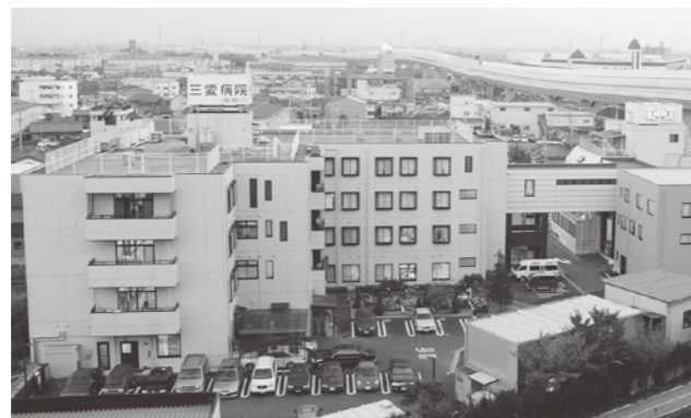
最先端の医療機器をそろえ「HHPJ」と提携した「三愛病院」

しかし、最先端の機材を導入することも大事だが、病院経営や人材育成も重要。 そこで松弘会は循環器分野に強い「ハートホスピタルパートナーズオブジャパン（HHPJ、本社東京）」と提携する。HHPJは患者満足度で全米トップクラスの「アーカンソ・ハートホスピタル（AHH、